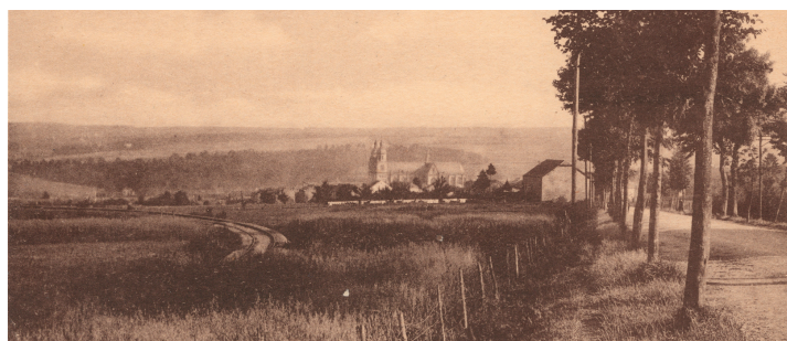
Carte postale ancienne non circulée. Panorama de Saint-Hubert depuis le haut de la rue du Mont. Dans la prairie, la boucle faite par la voie entre la rue des Rogations et la rue du Mont.

Moins de trente ans plus tard, le 7 octobre 1951, la liaison est fermée au trafic de voyageurs. La fermeture au transport de marchandises suit le 12 juillet 1954. Des services voyageurs Saint-Hubert – Bastogne via Amberloup seront toutefois maintenus les jours de marché à Bastogne jusqu'au 6 septembre 1954. La voie est déposée dans les derniers mois de 1954. Les autres lignes du groupe de Poix bénéficieront de quelques années de sursis, mais fermeront toutes entre 1956 et 1960.