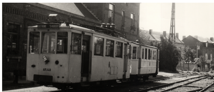
8 août 1953. Une rame de retour de Bastogne stationne en gare de Saint-Hubert.