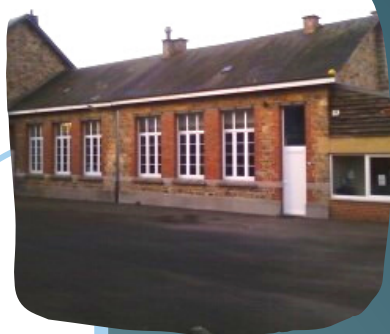
L'implantation de Vesqueville !

Où les enseignants portent leur attention à chaque élève pendant la classe et en dehors, peuvent mieux les suivre tout au long de leur scolarité et mieux respecter leur rythme propre .