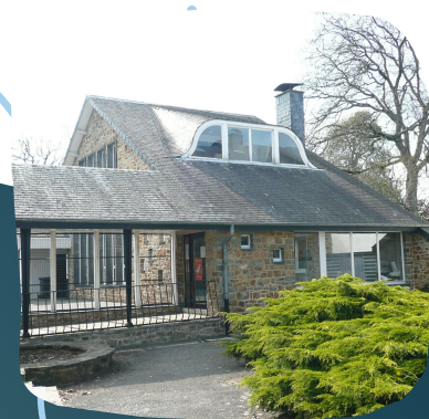
L'implantation d'Hatrival !