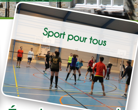
Sport pour tous