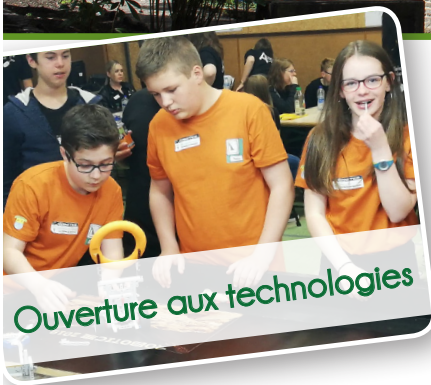
Ouverture aux technologies

www.libresthubert.be - Enseignement libre Saint-Hubert