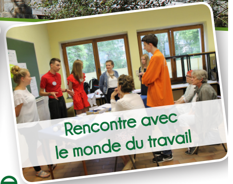
Rencontre avec le monde du travail