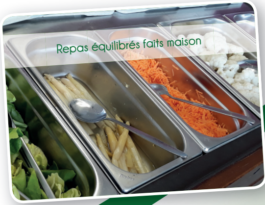
Repas équilibrés faits maison

Continuité de la maternelle au secondaire Projet d'intégration pour les enfants à besoins spécifiques