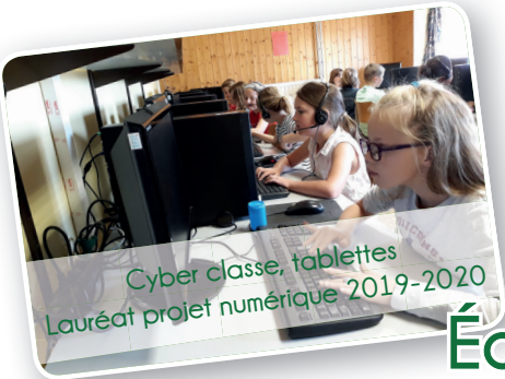
Cyber classe, tablettes Lauréat projet numérique 2019-2020

www.librethubert.be - Enseignement libre Saint-Hubert