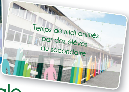
Temps de midi animés par des élèves du secondaire