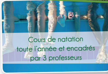
Cours de natation toute l'année et encadrés par 3 professeurs